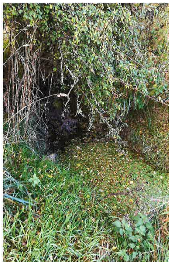
Bækken ender ved det sydlige skel .