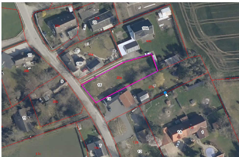
Oversigtskort: viser matriklen

Husets arkitektur passer ind i omgivelserne, men har samtidig en form for nyfortolkning af det klassiske længehus.