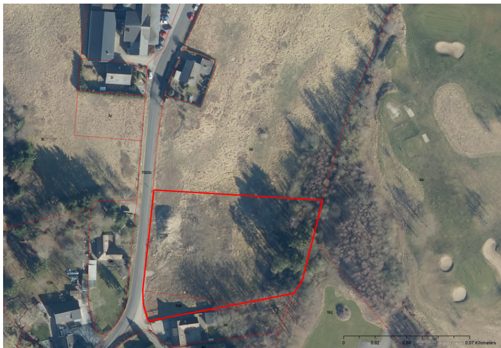
Kort 1 viser området som VVM-screeningen vedrør, markeret med fed rød streg.

En uddybning af ovenstående punkter kan ses i selve VVM-screeningen.