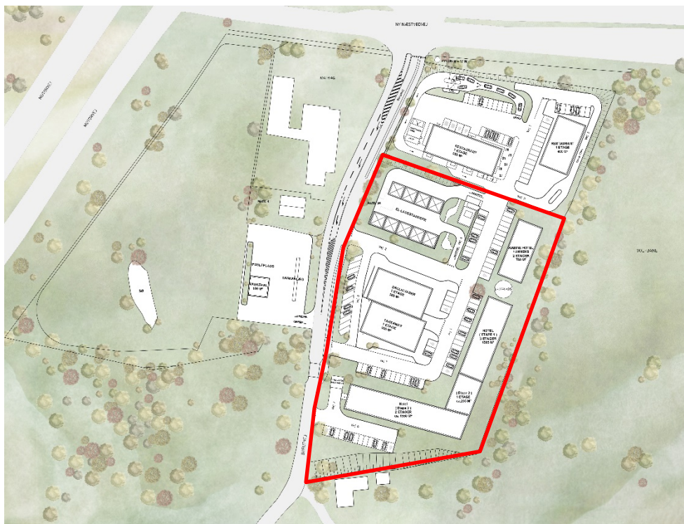
Kort 3 viser (med rød streg) det område, der er omfattet af forslag til lokalplan 1200-42. Kortet viser en overordnet illustrationsplan af områdets anvendelse.