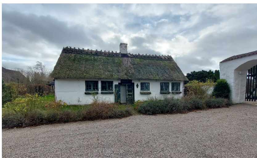
Billede 1: huset set fra p-pladsen ved kirken.