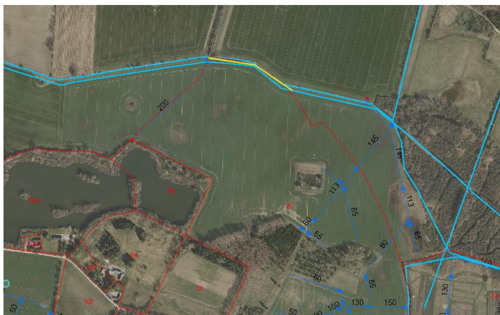
Figur 3. Den berørte strækning af Slimminge Å er vist med gul streg. Matrikler i Faxe Kommune er vist med rødt. §3-beskyttede vandløb er vist med lyseblå streg og dræen fra Hede Danmarks drænarkiv er vist med mørkeblå stiplede streg og pil.

På baggrund af dette vurderer Faxe kommune, at der ikke er offentlige afvandingsmæssige interesser i vandløbet.