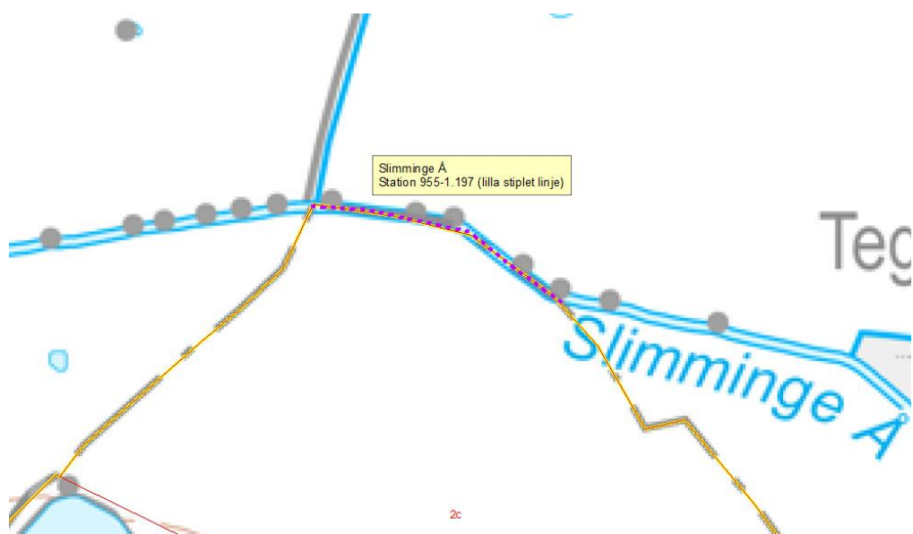
Figur 1. Lilla stiptet strækning er den berørte strækning som nedklassificeres. Vandløbet danner her kommunegrænse mellem Køge - og Faxe Kommune.

Beliggenhed fremgår af nedenstående kortbilag.