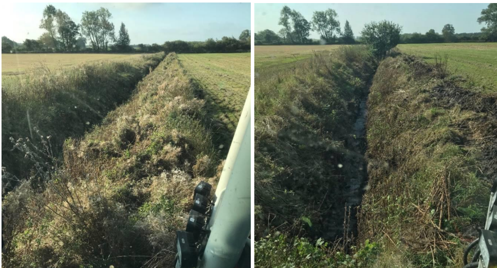
Figur 4. Fotos af Turøgårdløbet taget i forbindelse med vandløbsvedligeholdelsen i september 2020.

På baggrund af en kontrolopmåling har Faxe Kommune i september 2020 foretaget vedligeholdelse og oprensning af vandløbet, til sikring af at vandløbet er i regulativmæssig stand inden overdragelse.