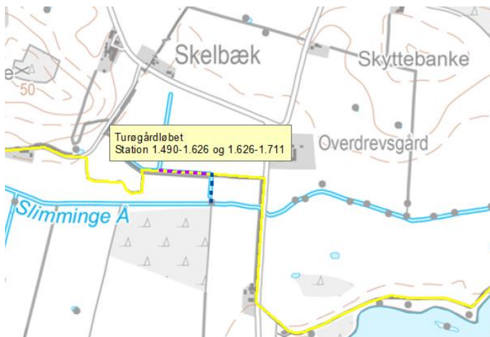
Figur 1. Strækning som nedklassificeres. Lilla stiplet strækning danner kommunegrænse mellem Køge og Faxe Kommune. Blå stiplet strækning er alene beliggende i Faxe Kommune. Gul linje er kommunegrænsen.

Beliggenhed fremgår af nedenstående kortbilag.