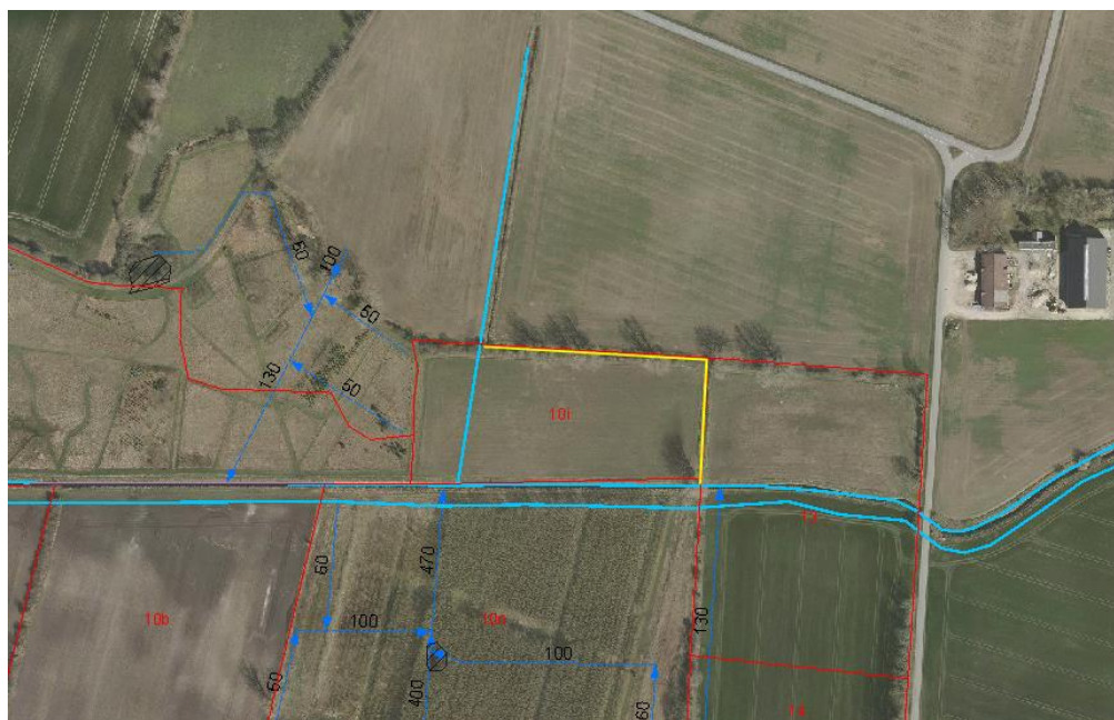
Figur 5. Den berørte strækning af Turøgårdløbet er vist med gul streg. Matrikler i Faxe Kommune er vist med rødt. §3 beskyttede vandløb er vist med lyseblå streg og dræn fra Hede Danmarks drænarkiv er vist med mørkeblå stiplede streg og pil.

Oplandet til vandløbet består således med al sandsynlighed udelukkende af marker i intensiv omdrift, og der er ikke kendskab til, at andre interessenter skulle bidrage med vand til vandløbet.