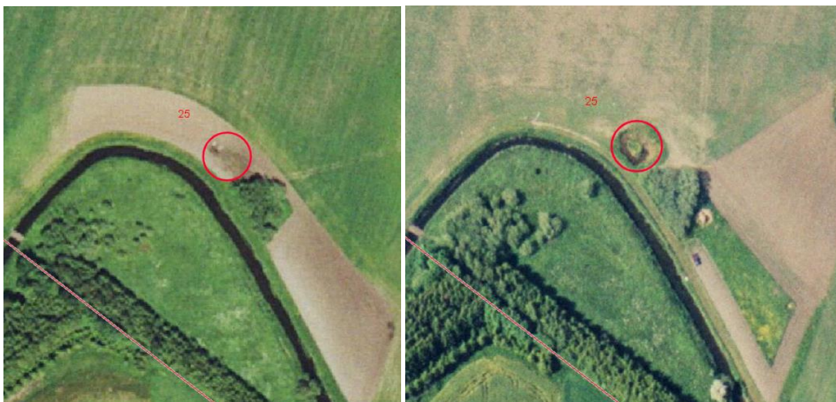
Figur 4: På luftfotoet fra 2002 (billede tv.) ser der ingen sø inden for det markerede område. Inden for det samme område, bliver der i 2004 gravet en sø (billede th.).