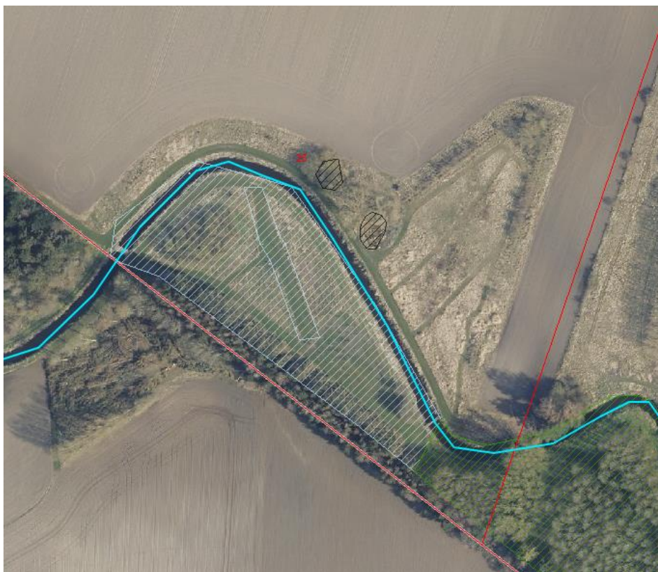
Figur 2: Luftfoto fra 2021, samt lag for § 3- beskyttet natur på ejendommen. Her ses søer, vandløb, enge og moser med henholdsvis de sorte, blå, hvide og grønne markeringer.