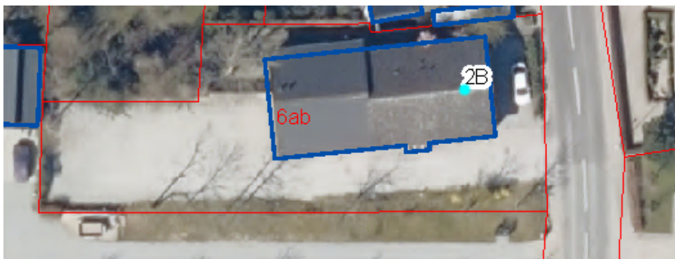
Oversigtskort 1) eksisterende bygning