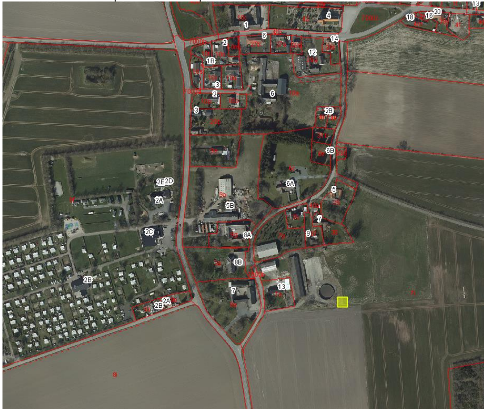
Kort 1 viser mastens placering (med gul firkant)

Mastens ønskes opsat som vist på kort 1 nedenfor.