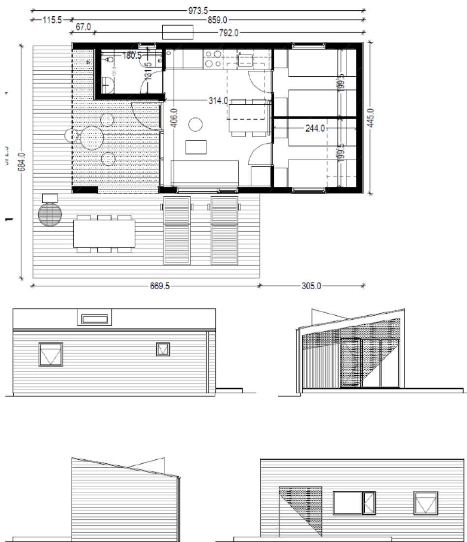
Figur 1 – Udseende og plantegning over en campinghytte.