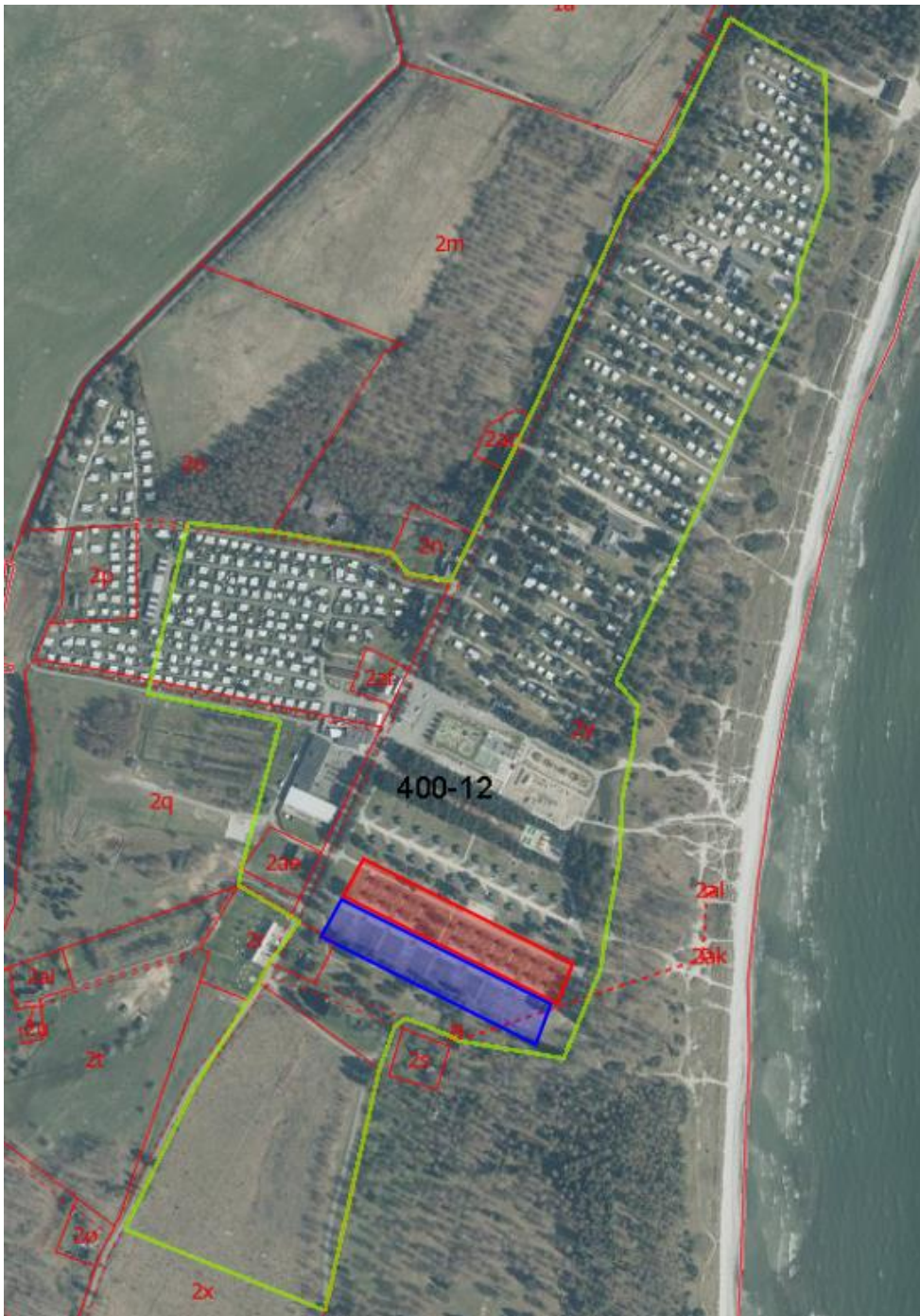
Kort 2 – Kort over campingpladsen (lysegrøn streg er lokalplanens afgrænsning). Med rødt er vist, hvor campinghytterne placeres på pladsen. Med blå er vist, hvor servicebygningerne placeres.