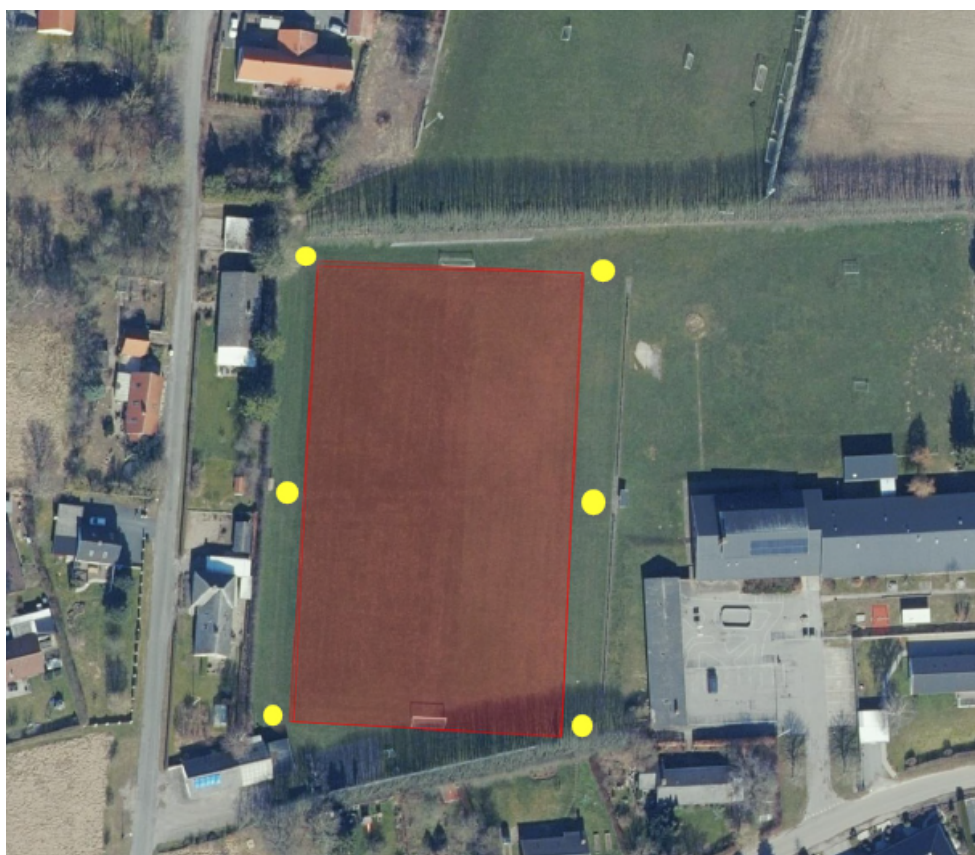
Figur 1: Markering af 11-mandsbanen samt opsætning af ansøgte lysmaster

Lysmasterne er 18 m høje, og der vil være 10 LED armaturer: 2 i hvert hjørne og 1 i hver af masterne, som står på banens langside. Lysmasterne placeres 4-5 m fra banens sidelinjer. Faxe kommune har modtaget en beregning af spildlys, og vurderer umiddelbart at ansøgte lysmaster vil kunne overholde gældende grænseværdier.