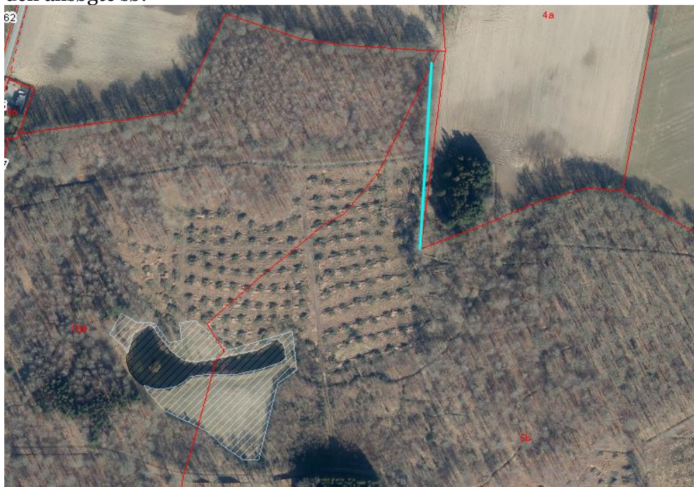
Beskyttet sten-/jorddige markeret med turkisblå

På ejendommen findes der et beskyttet sten-/jorddige på den østlige bred af den ansøgte sø: