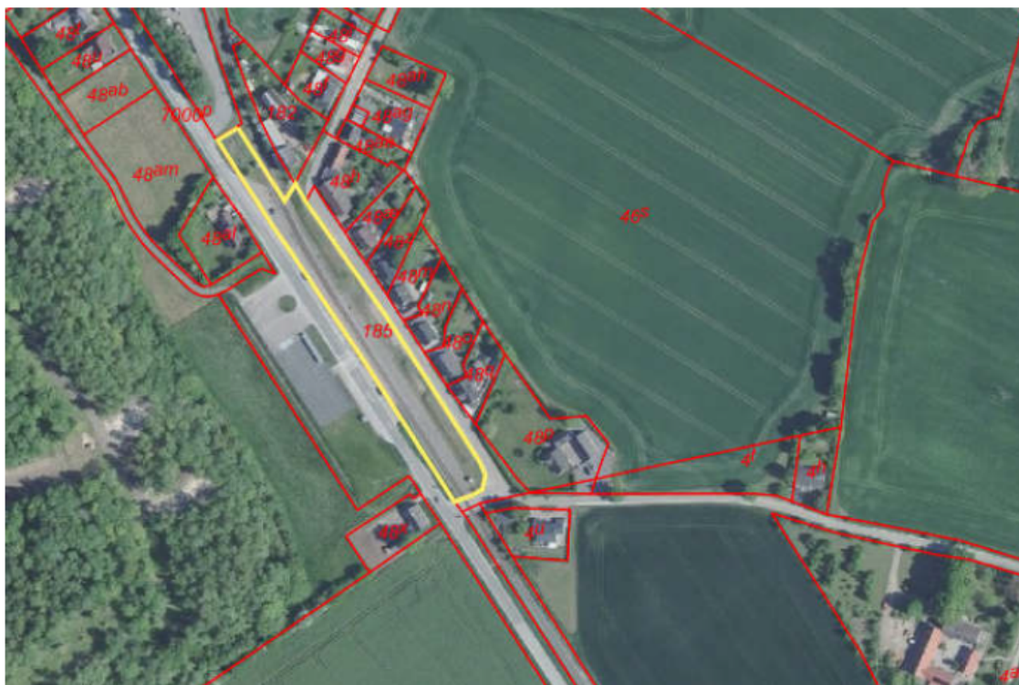
Arbejdspladsareal 11: Faxe Syd Station