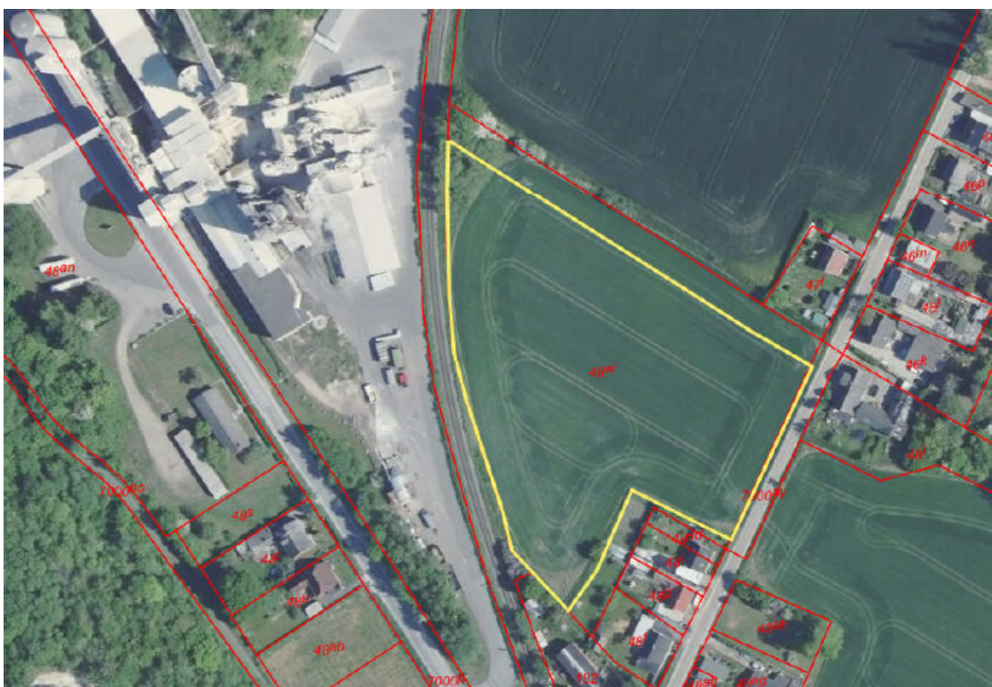
Arbejdspladsareal 10: Nord for Faxe Syd Station