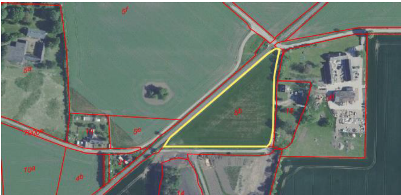
Arbejdspladsareal 5: Ved Jørslevvej og Jørslev Vænge