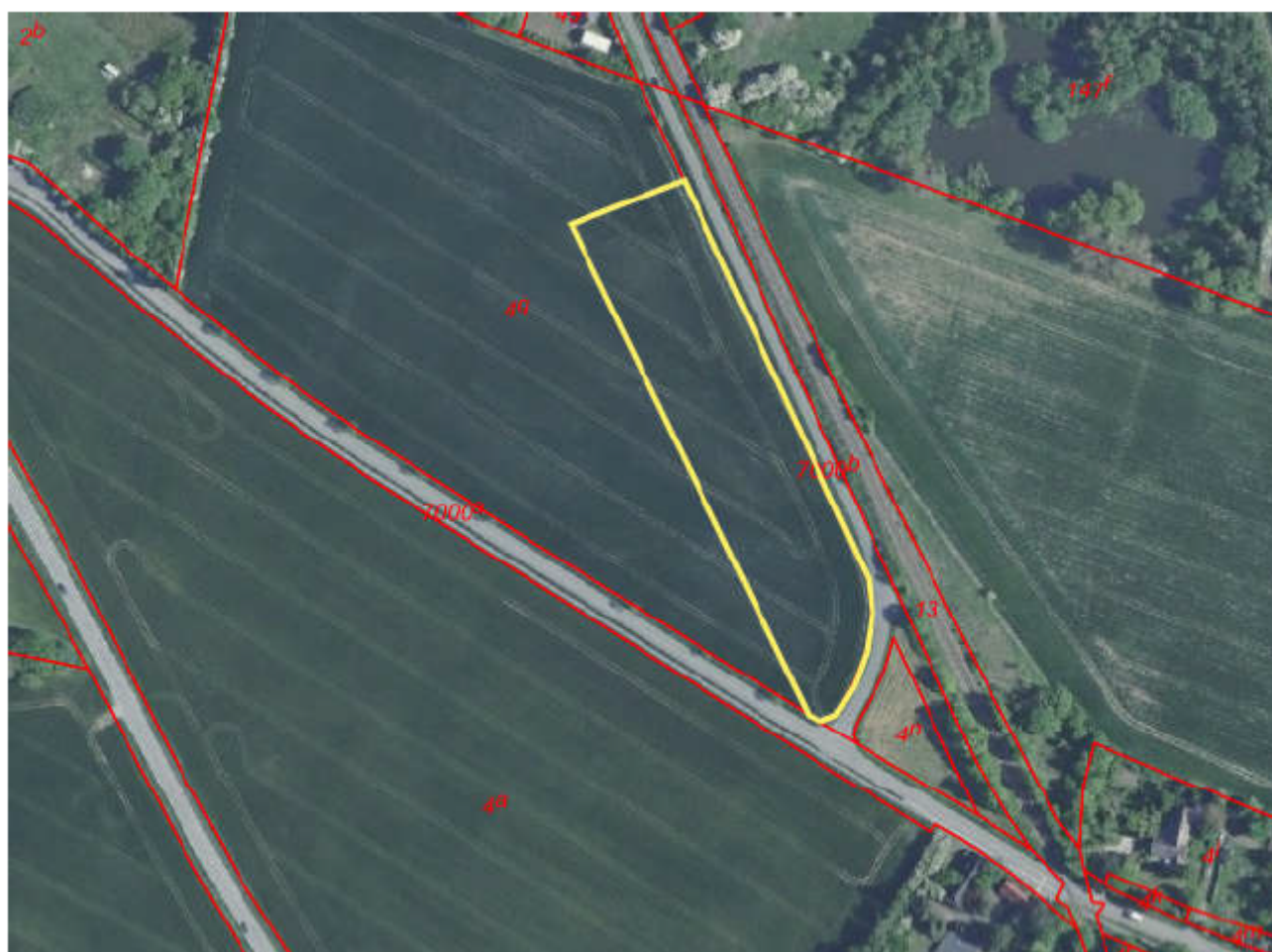
Arbejdspladsareal 14: Ved Faxevej