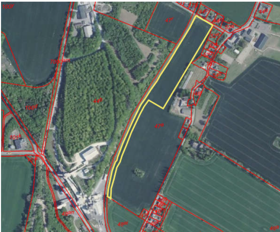
Arbejdspladsareal 9: Ved Stubberupvej