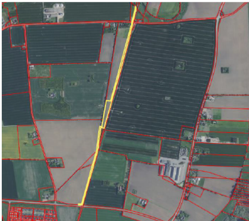
Arbejdspladsareal 1: Ved Tinghusvej