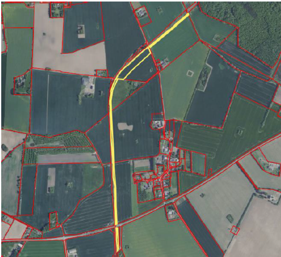
Arbejdspladsareal 7: Ved Tokkerup Station