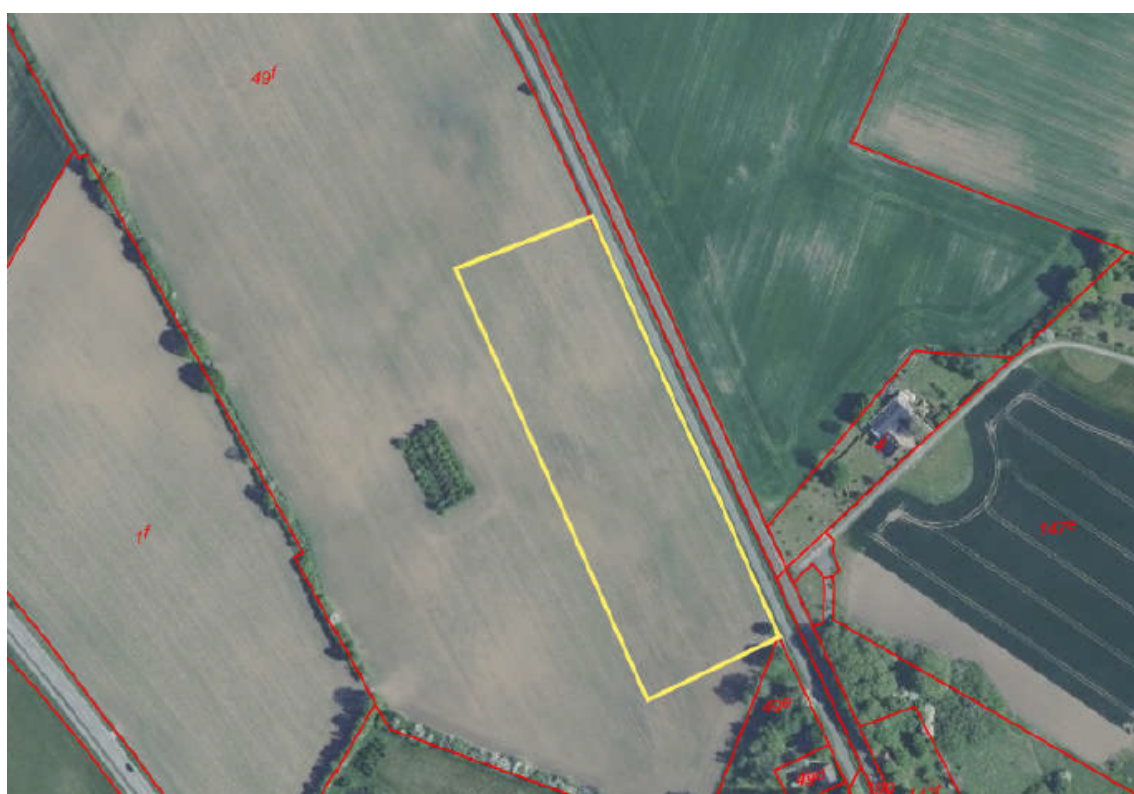
Arbejdspladsareal 12: Ved Stengårdsvej