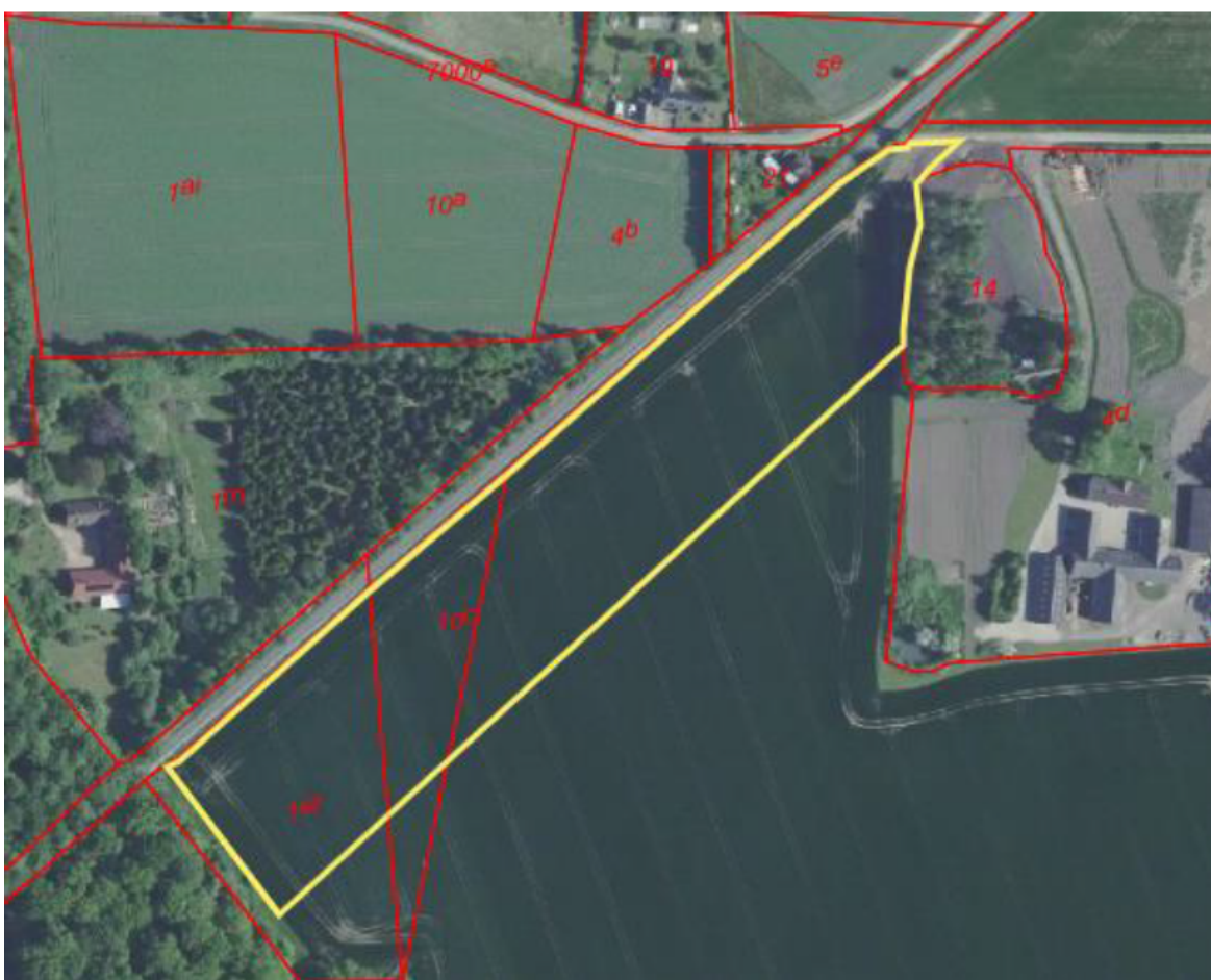
Arbejdspladsareal 6: Ved Jørslev Vænge