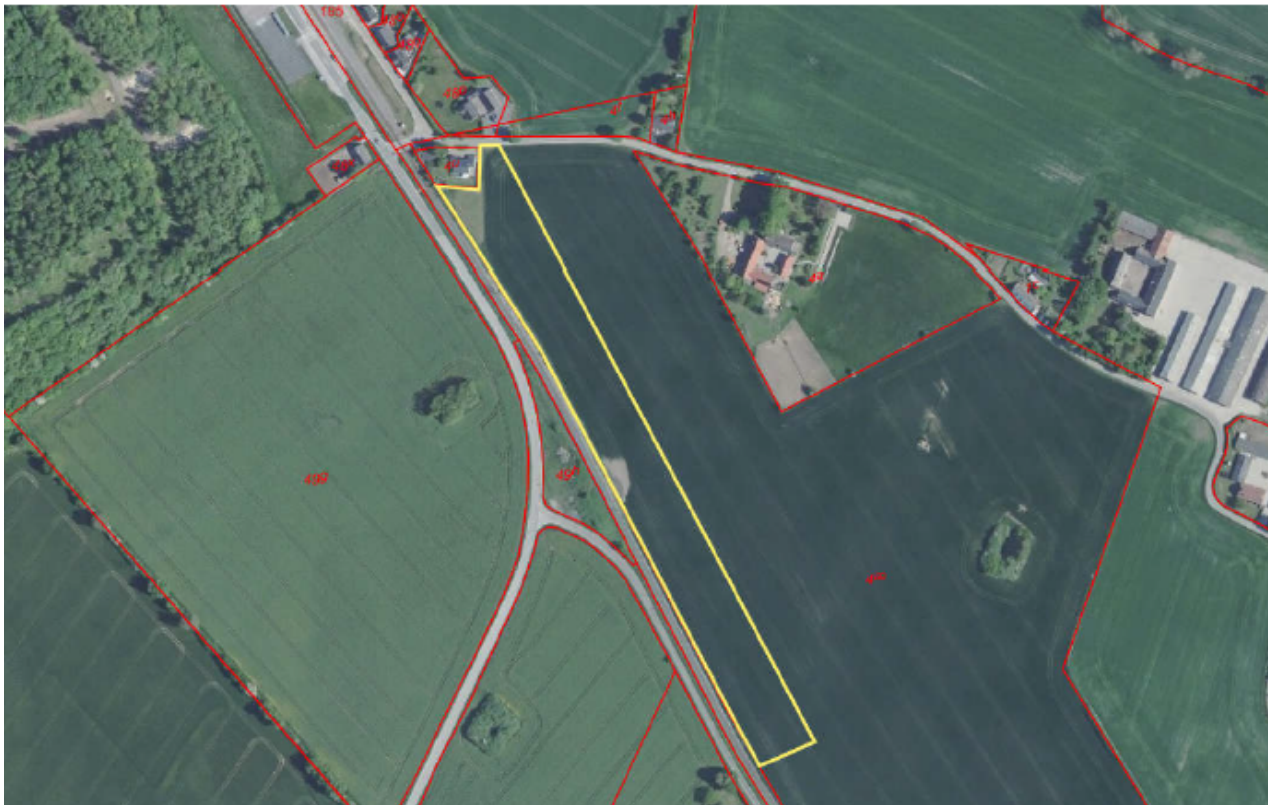
Arbejdspladsareal 13: Syd for Faxe Syd Station