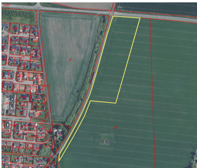
Arbejdspladsareal 2: Ved Dalbyvej