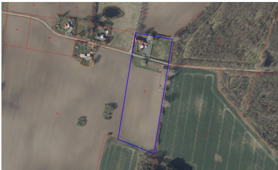
Kort 1: Oversigt over matrikel 61 på Sneden 15, 4683 Rønnede (blå) set fra 2021.

Yderligere befinder der på ejendommen én beskyttet jorddige langs ejendommens østlige matrikelskel. Faxe Kommune har også oplysninger om, at der kan være to dræn under den syd og østlige del, hvor ridebanen ønskes anlagt.