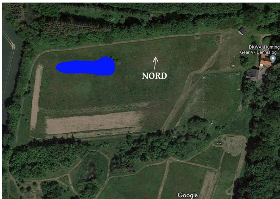
Kort 1 - Indsendt ønsket placering af sø

I Faxe Kommunes landskabskarakteranalyse ligger ejendommen i område 10 – Kobanke bakkeparti og skovklædte landbrugslandskab – delområde M2. For dette område gælder særligt at landskabet skal vedligeholdes og at der flere steder kan opnås gode udsigter. Området rummer mange små søer (jf. kort 3) i de generelt landbrugsmæssigt anvendte områder, og fortsat landbrugsmæssige anvendelse er væsentlig for fortsat at kunne opleve det varierende terræn.