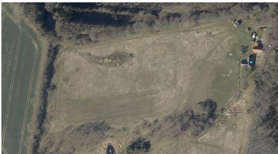
Kort 2 - Lavning fra tidligere sø ses hvor ansøger ønsker at etablere ny sø