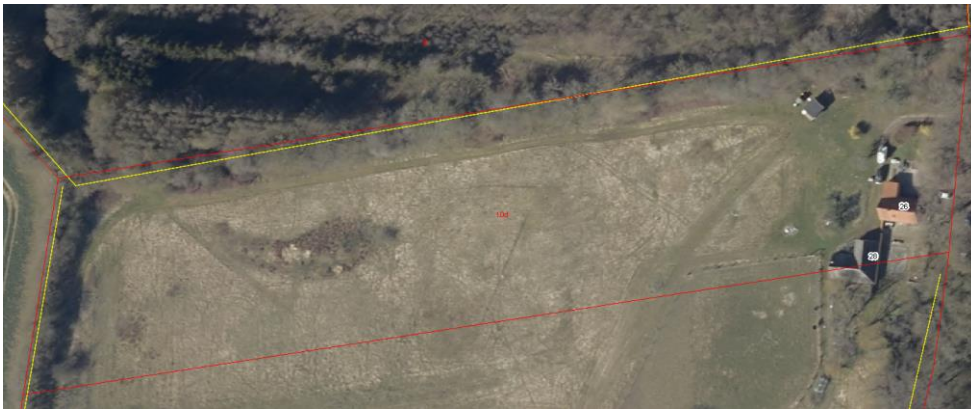
Kort 4 - Beskyttede sten- og jorddiger markeret med gule streger