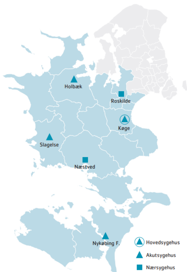
Figur 1: Den vedtagne sygehusstruktur. (Kilde: Sygehusplan for Region Sjælland, 2010, s. 30).